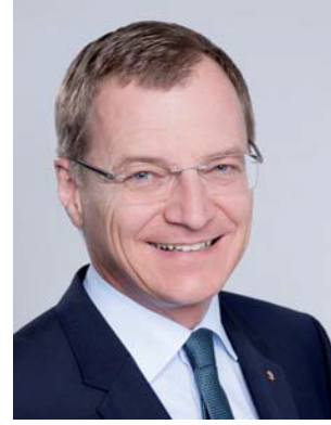
Mag. Thomas Stelzer Eyalet Başbakanı